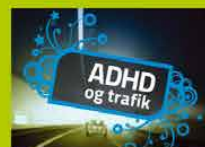
ADHD og trafik