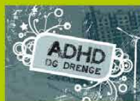
ADHD og drenge