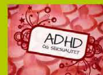
ADHD og seksualitet