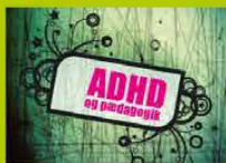
ADHD og pædagogik