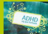
ADHD og parforhold