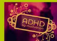
ADHD og motivation