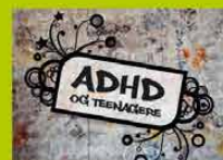
ADHD og teenagere