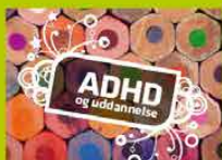
ADHD og uddannelse