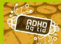
ADHD og tid