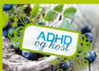
ADHD og kost