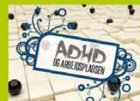
ADHD og arbejdspladsen