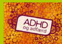
ADHD og adfærd