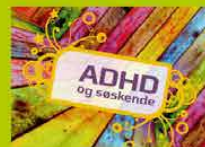
ADHD og søskende