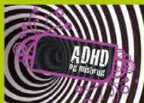
ADHD og misbrug