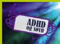
ADHD og søvn